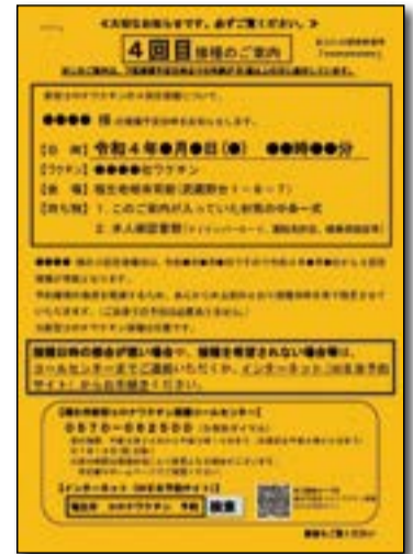
▲ 4回目接種のご案内

※福生市に転入してきた方で、接種を希望される場合は、接種券の発行申請後、ご自身で接種予約（コールセンターまたはWEB予約サイト）をお願いします。