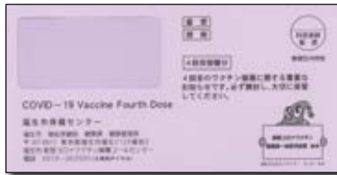
▲ 4回目接種の書類をお送りする封筒（紫色）