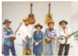
単純、素朴、悲哀に満ちた軽快な音楽で、ハンジヨ、ギター、ベース、マンドリン等の演奏と歌をお楽しみください。

【場所】公民館本館ほか 【対象】高校生以上の方(市外の方も歓迎です) 【問合せ】公民館公民館係 ☎ 552・2118