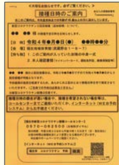
▲接種日時のご案内

一部の方(※)を除き、65歳以上の方は接種日時を指定させていただきます。上記の「接種日時のご案内」(オレンジ色の紙)が同封されますのでご確認ください。