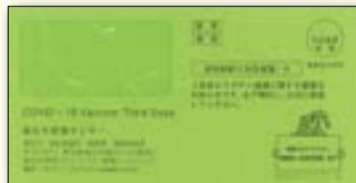
▲ 3回目接種の書類をお送りする封筒はこちらです(緑色)