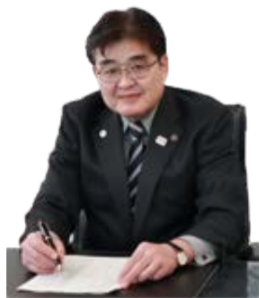
福生市長 加藤育男