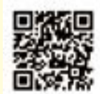
▲投票特設ページ QRコード

LINE スタンプ候補の中から「良いな」「使いたい」と思ったスタンプを選んで、次のURLまたはQRコードから特設ページにアクセスして投票してください(複数のスタンプ候補を選択できます)。