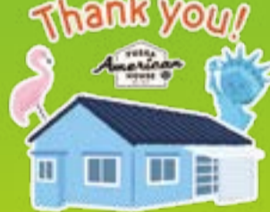
※スタンプ案の一例です