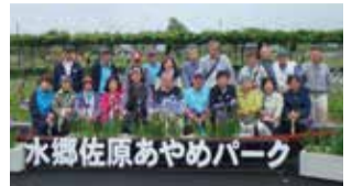
▲ふっさ花とみどりの会視察研修

市内を花とみどりでいっぱいにしてほしいという思いで、平成20年に「ふっさ花とみどりの会」は発足しました。現在、やなぎ通りのプランターへの植栽、多摩川中央公園の花壇への植栽や管理など、市内を花でいっぱいにする企画や活動を行っています。