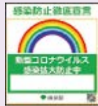
▲東京都発行の「感染防止徹底宣言ステッカー」

③感染症対策を実施し、東京都の発行している右記の「感染防止徹底宣言ステッカー」を掲示している事業者であり、引き続き感染症対策を実施する意思があること