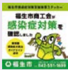
▲福生市感染症対策支援事業ステッカー

なお、ガイドラインに沿った対策を講じている事業者には、商工会が作成した右記のステッカーをお渡ししますので、東京都の「感染防止徹底宣言ステッカー」と並べて掲示してください。