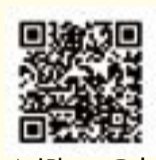
▲ iPhone の方