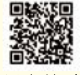
▲ Android の方