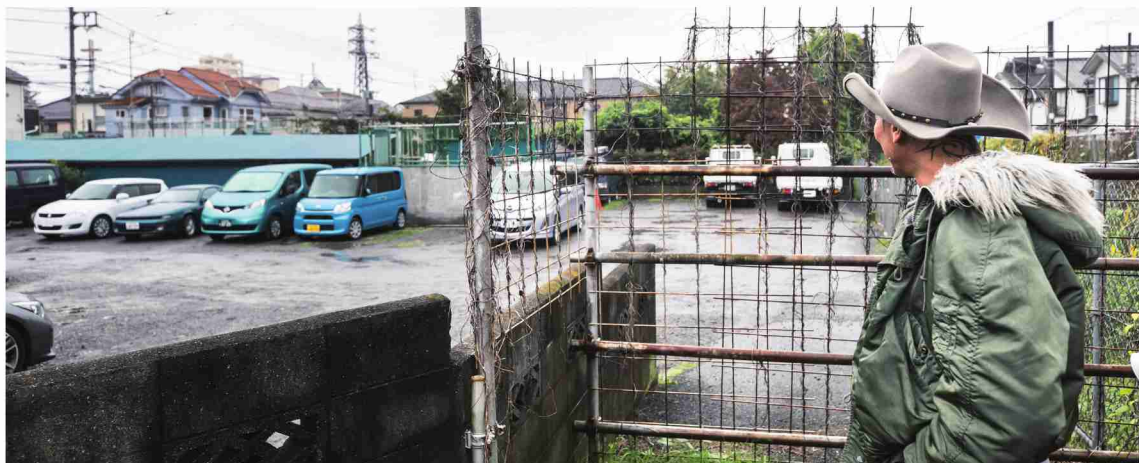
「ここもぬけの殻。」原口監督の元工房だったアメリカンハウスは取り壊されていた