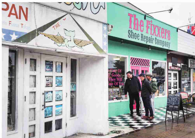
国道16号線沿い 昔から米軍向けのレストランや海外商品を扱うストアが軒を連ねていた