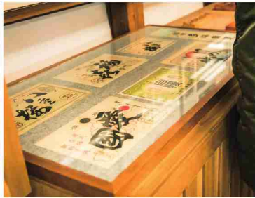
史料館ではお酒づくりの様々な歴史を展示