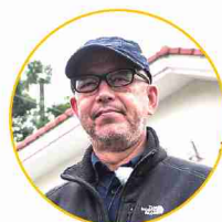
尾上 克郎 監督

映画監督・特技監督・特殊メイクアーティスト。代表作は「ウルトラマンメビウス」。かつて米軍ハウスで制作活動を行っており、福生への造詣が深い。