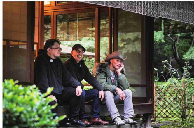
純和風建築ならではの落ち着いた佇まい

『シン・ゴジラ』のロケ地のひとつでもある「福庵」。久しぶりの訪問に樋口監督と尾上監督の思い出話にも花が咲く。