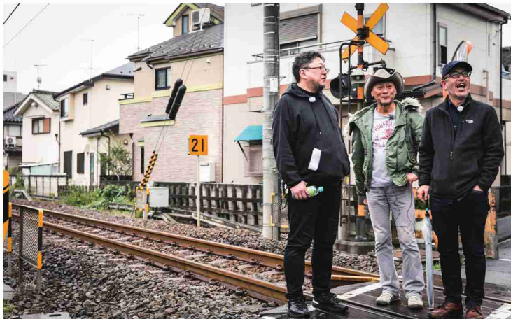
JR八高線 「あの分かれ道とかいいよね」珍しい単線の風景に会話が弾む監督たち

原口 東京都内でこういう場所ってとても珍しいよね。映画『シュガー&スパイス』も、この東福生駅を舞台にロケされているみたいです。