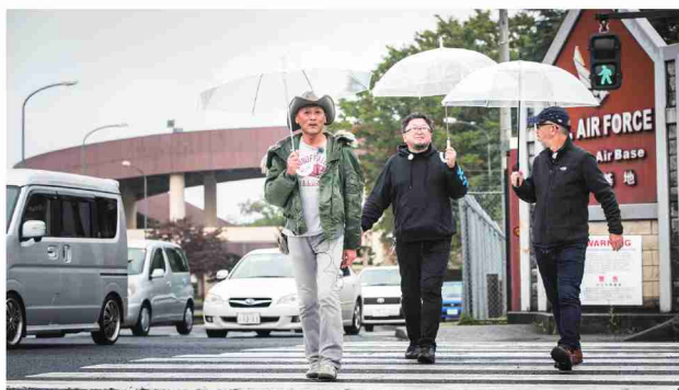
横田基地 第二ゲート前

さらに歩くと目指す第二ゲート前に到着。大きなゲートの向こうには、横田基地の広大な敷地が広がる。