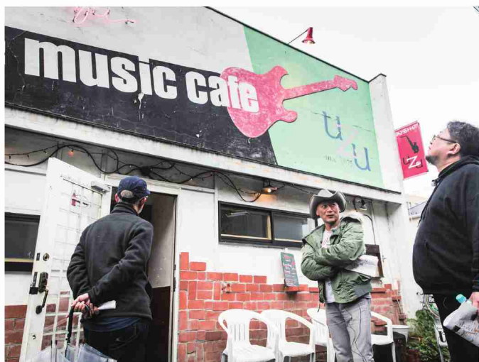
「Live Music Café UZU」 名前は変わったが建物は昔のままだった