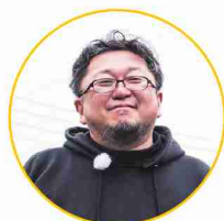
樋口 真嗣 監督

なぜ映画人は福生に惹かれるのか？ 福生のカルチャーの魅力とは？ 映画界の第一線で活躍する、樋口真嗣監督、尾上克郎監督、原口智生監督が福生に集合。映画のロケ地や舞台になった場所を中心に福生のまちを探訪し、その魅力を辿る。