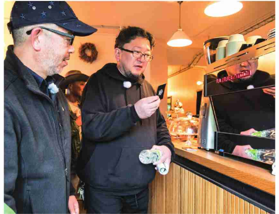
アメリカンハウスの中でコーヒーが飲める 思わずショップカードを手取る監督