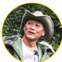
原口 智生 監督

映画監督・特技監督。映画「ゴジラ」にて映画界入り。主な監督作品は「シン・ゴジラ」、「進撃の巨人」、「ローレライ」など。