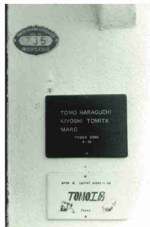
後輩とシェアしながら工房として使用していた