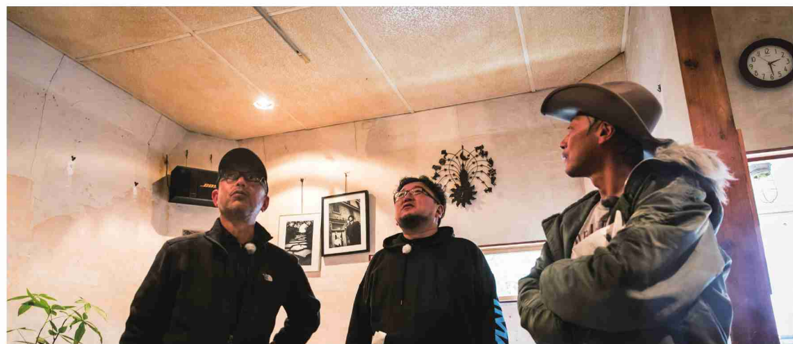
「Live Music Café UZU」の店内