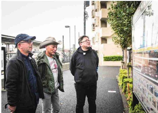
東福生駅前 左から尾上克郎監督、原口智生監督、樋口真嗣監督