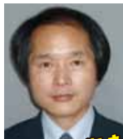
家具から街まで デザインする