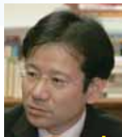
明日の教育を デザインする男