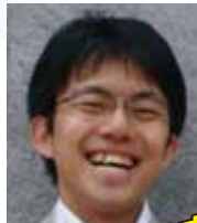
地域を元気にする！ エリア・イノベーションの トップランナー