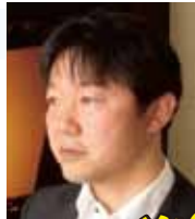
都市デザインの演出家